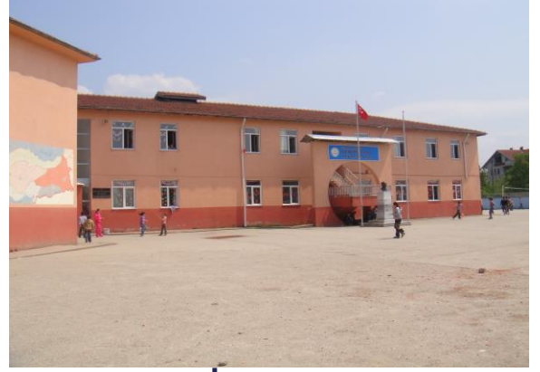
Yeni Yüzyıl İlköğretim Okulu